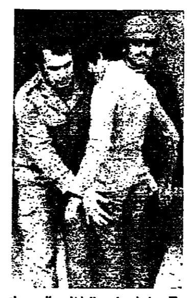
تفتيش أحد الداخلين إلى سراي صيدا

في خريف ١٩٧٥ كنت في القاهرة، وكان خوفني - كل خوفني - في ذلك الحين على وطني لبنان. وظلت مومسدا من الرئيس أنور السادات، فتطقت وجدد الموعد في القاهر الخيرية. وهناك، على شاطئ النيل، فوق بساط أخضر تطلله الأشجار الوارفة سعيد فريحة